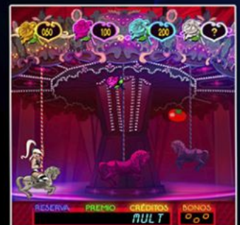
Atrapa el Premio