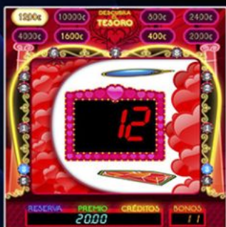
Descubre el Tesoro