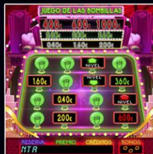
Juego de las Bombillas