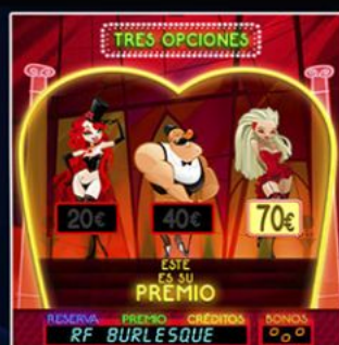
Juego de las Tres Opciones