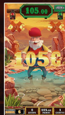
Juego Se Busca