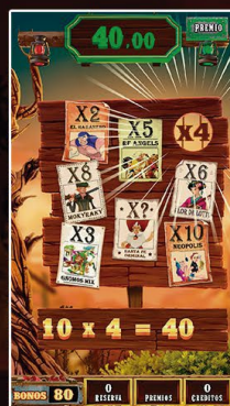
La fiebre del Oro