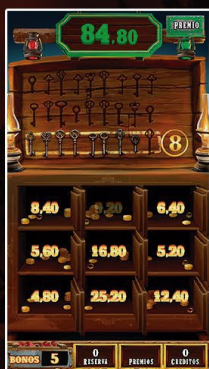
Las Cajas Fuertes